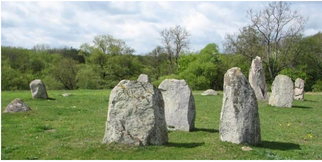
Bautastenarna söder om Örakarsgården.

utforskningar. Senast utgrävningarna vid Maletofta. Stenåldern, järnåldern, bronsåldern har satt sina spår i landskapet.