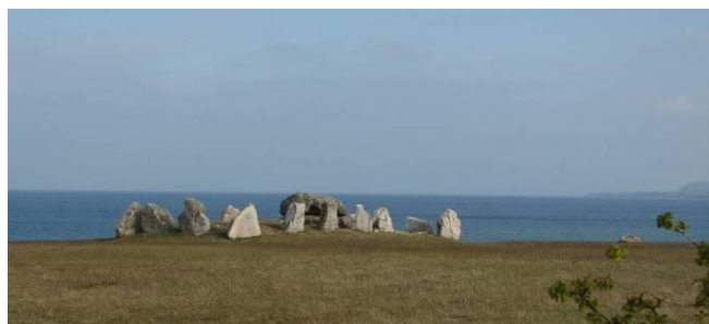
Havängsdösen kom fram ur sanden efter en storm år 1843.

Havängsdösen, Knäbäcksdösen, Verkeåns mynning med hamnanläggningen och skogen i havet. Bautastenar och jordhögar, allt bär på en historia. Många sakkunniga har varit här och gjort