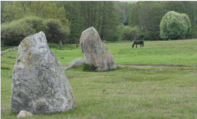
Resta stenar väster om Örakarsgården.

http://www.fmis.raa.se/cocoon/fornsok/search.html;jsessionid=A3EB688E2EC3C73A6733C8632E94496C?objektid=10110500400001&tab=3